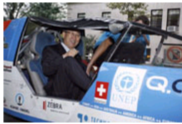
潘基文乘坐“太阳能出租车”

2008年9月12日 潘基文秘书长星期五乘坐一辆“太阳能出租车”来到纽约总部上班。这辆依靠太阳能提供动力的小车去年夏天从瑞士出发进行环球旅行，它的设计者希望以此唤起全球对于替代能源的关注。