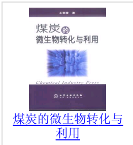
煤炭的微生物转化与利用