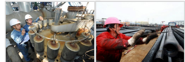
锦州石化焦化车间新策略 “问计”长周期 | 辽河特油公司: 调结构打出“组合拳”