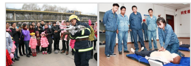
呵护幼苗安全成长 | 培训技能保安全