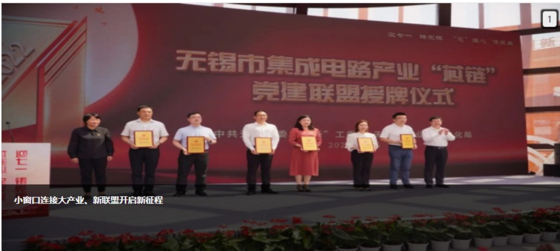
小窗口连接大产业，新联盟开启新征程