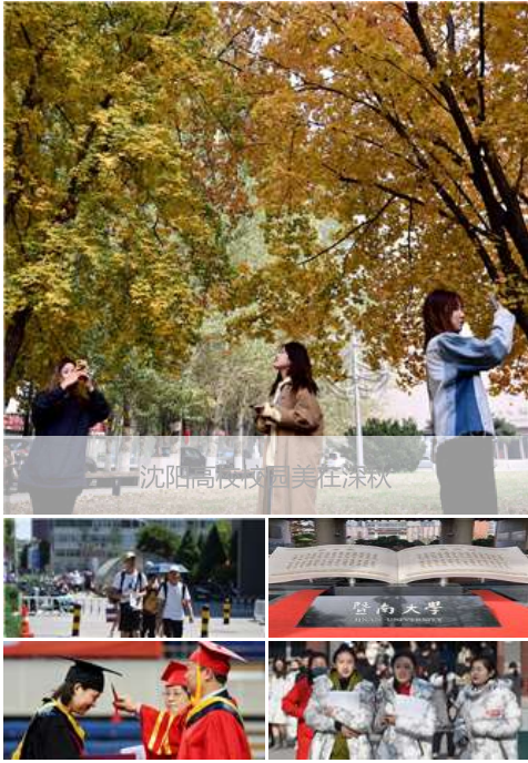
沈阳高校校园美在深秋

2019公共政策国际会议在华中师范大学举行 “中国之治”公共管理学院论坛在暨大举行 外语学科发展高层论坛在北京大学外国语学院举行 北师大：结合中心工作 培养“四有”好老师 人民楷模王启民走进东北石油大学思政课堂 “文化遗产与社会认同”学术沙龙在南科大举行 北京大学国际组织人才培养论坛在京举行 以“社会大课堂”激活“思政小课堂” 广东涉外法治人才培养基地落户户外 为公共治理现代化提供全球智力支持 “龙腾吉大”午间沙龙第11期：聚焦“智能+” “2019可持续发展目标—新思想与全球实践”论坛在举 福州大学社科助力地方经济社会发展