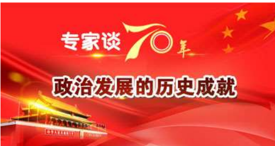
【图解】专家谈70年政治发展的历史成就