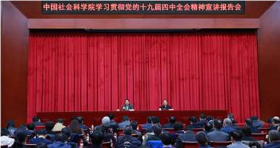
中国社科院举行学习贯彻十九届四中全会精神宣讲报告会