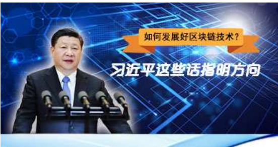
如何发展好区块链技术？