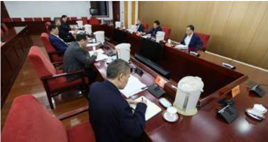
中国社会科学院党组传达学习贯彻党的十九届四中全会精神