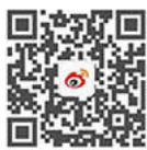
东华大学校方微博