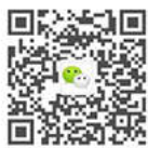
东华大学校方微信订阅号