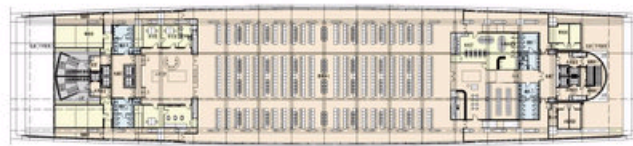
新闻中心平面图 0 10 20m