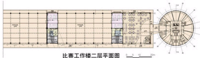
比赛工作楼二层平面图 0 10 20m