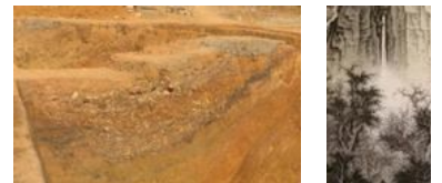
广西贵港考古大发现：旧城区挖出汉 工笔山水的意 代护城壕