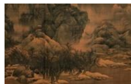
天津博物馆馆藏中国古代书画

评审会上，与会专家高度肯定了本项目取得的工作成果。一致认为，项目从课题设计到实施，有明确的学术目标，有合理的技术路线，有科学的工作理念和方法。工作机制采取省级考古单位牵头，联合大学、市县文博单位合作，并将调查勘探的野外作业委托有丰富田野经验的公司来负责实施，大大提高了工作效率。从立项至今短短3年，高效完成了目前国内最大面积的考古调查工作，所发现的遗址数量也是最多的，取得的成绩非常出色。项目的实施与资料的提交，规范翔实，成果转化快，堪称典范。这项工作所形成的创新工作方法对于南方同类地形、地貌条件下的考古调查与研究具有示范和推广意义。