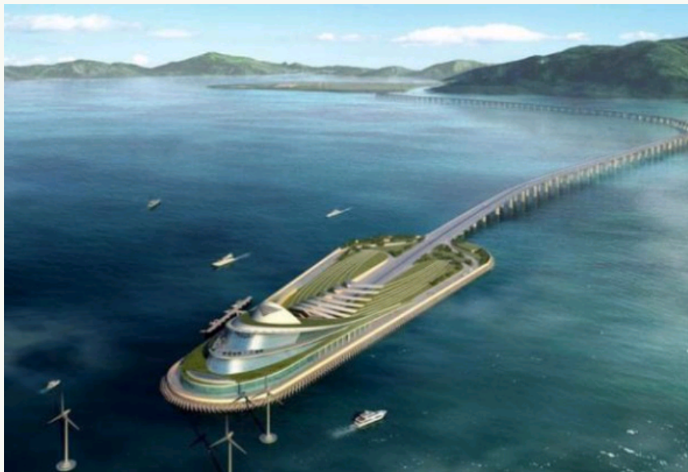
世界最长的跨海大桥——港珠澳大桥于2009年12月正式开工建设