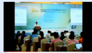
2013中国汽车防腐技术论坛