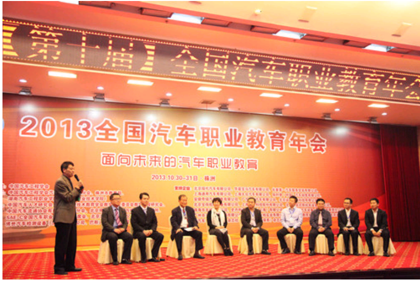
课程设计大赛专家、选手互动讨论环节

为了给年会代表、汽车职业院校的教师及相关人员提供更好的学术交流氛围，本届年会论文集《面向未来的汽车职业教育》作为正式出版物出版。截止专辑发稿，共收到来自全国的77篇论文，其中34篇被收入专辑，8篇被评为优秀论文，并在本届年会闭幕式上为优秀论文获奖作者颁发证书。