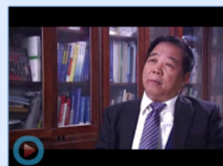
中国汽车工程学会50周年 短片