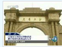
中央电视台新闻联播：