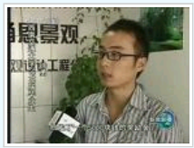
中央电视台新闻联播