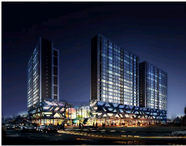
万象城公交综合体 West Bus & Tramway Complex