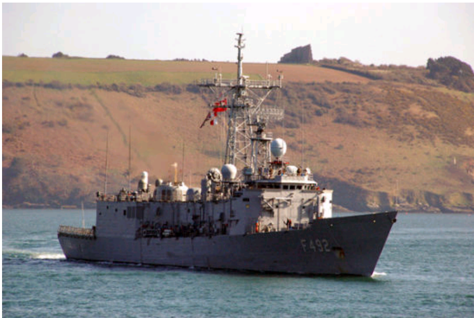
土耳其海军 “盖姆利克”号导弹护卫舰 (F492 Gemlik)

据国防科技信息网消息, 据防务新闻网2011年9月27日报道, 2011年9月27日, 土耳其自行建造的首艘军舰“雷贝里岛”号服役, 该舰是一艘轻护舰。而该级轻护舰的第二艘在伊斯坦布尔下水。