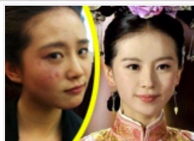
《步步惊心》若曦鱼祛痘