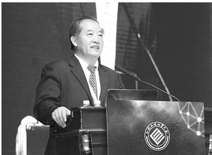
中科院院士江桂斌作报告。

本报讯 为进一步交流环境化学研究的最新成果,探讨环境化学发展的战略方向,促进环境化学研究的创新,“第八届全国环境化学大会”近日在广州举行。会议由中国化学会环境化学专业委员会和中国环境科学学会环境化学分会主办,华南理工大学承办,中科院广州地球化学所、中科院广州能源所等单位共同承办。