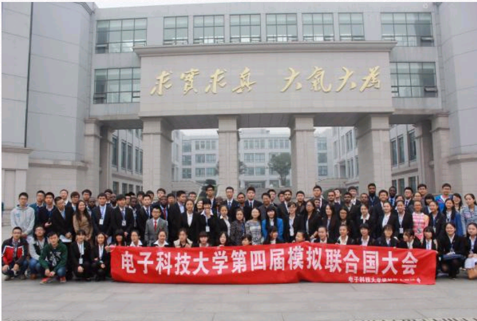
第四届模拟联合国大会集体合照