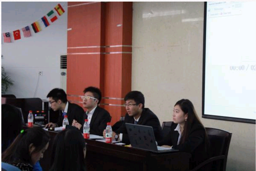
英文委员会主席团成员听取各国代表发言