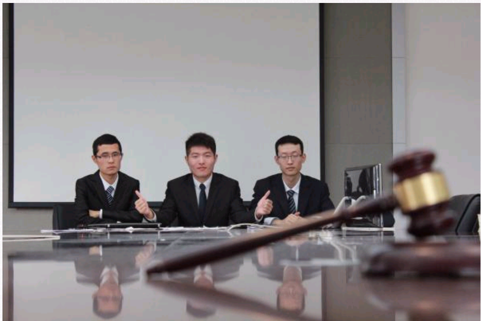
中文委员会主席团成员