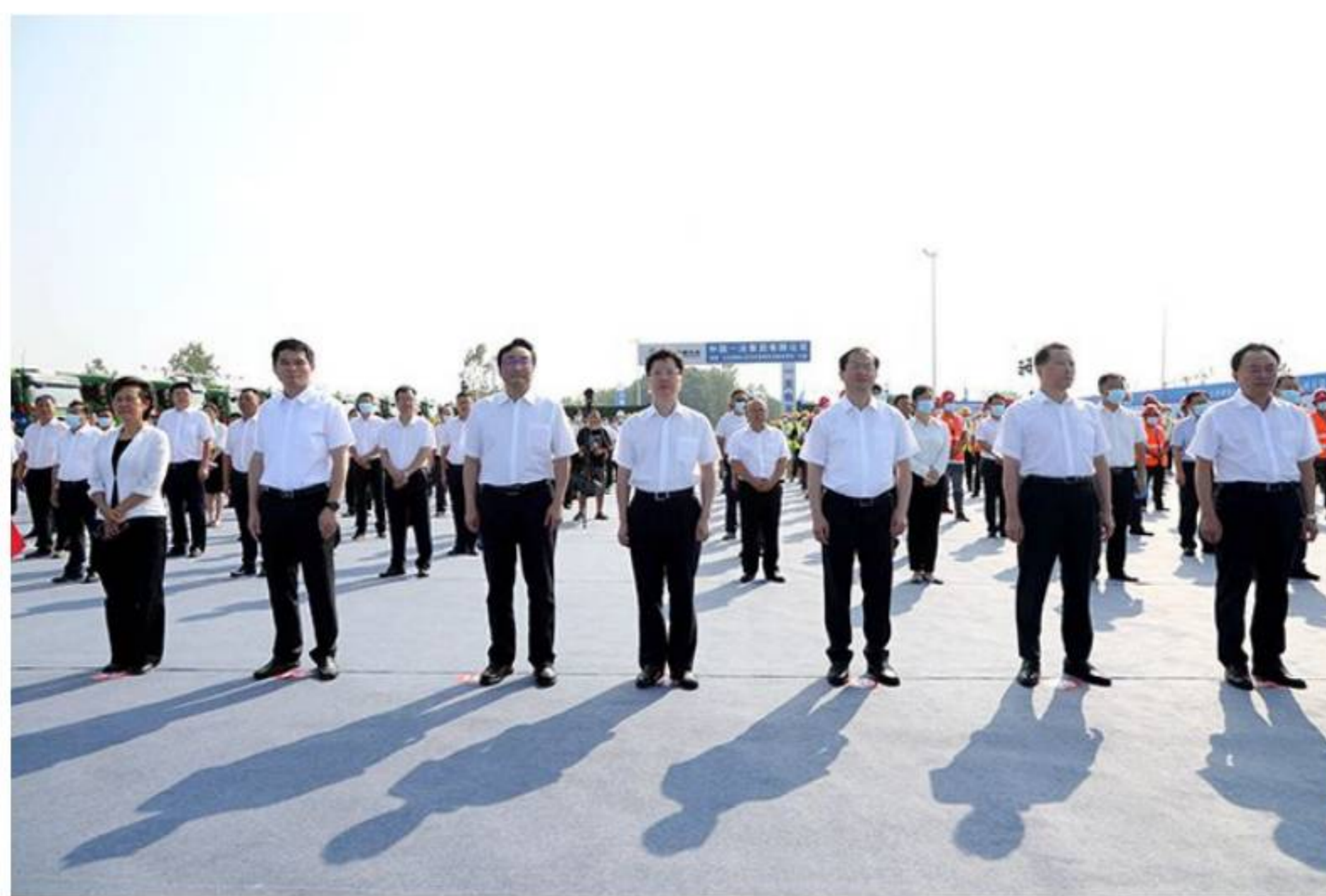
集中开工活动现场