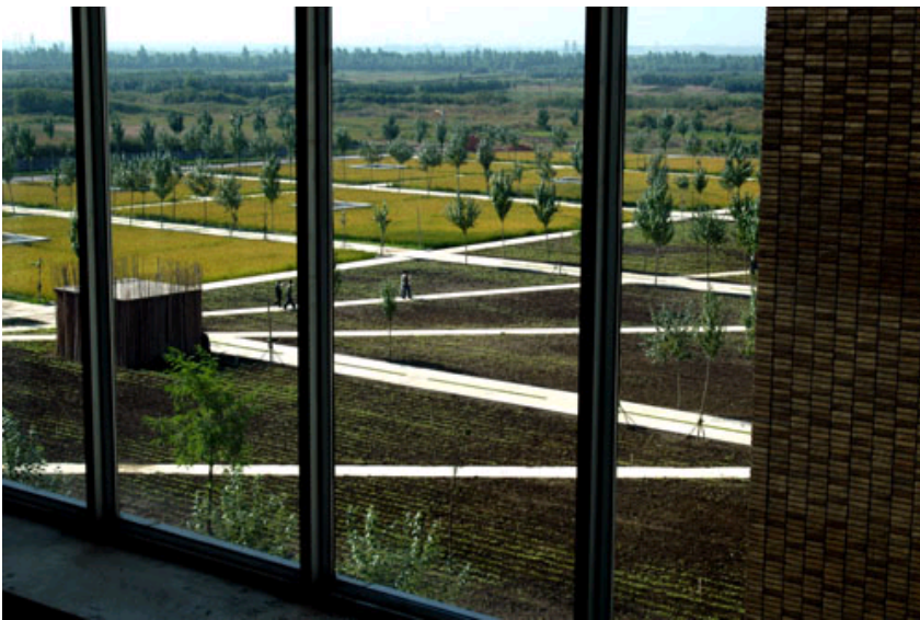
沈阳建筑大学：将书声溶入稻响