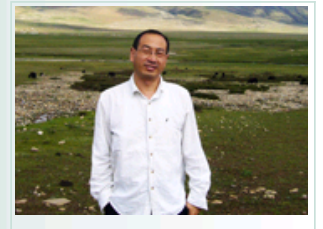
专访张成梁：矿山修复技术市场