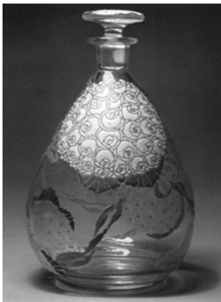
图1 德尔沃克斯设计的玻璃瓶

1925年，法国装饰艺术家协会在巴黎举办了“国际现代装饰与工业艺术博览会”，“艺术装饰风格”（ART DECO）由此得名。艺术装饰风格是20世纪20~30年代主要的流行风格，它生动地体现了这一时期巴黎的奢侈与豪华。艺术装饰风格以其富丽和新奇的现代感而著称，但它实际上并不是一种单一的风格，而是两次大战之间统治装饰艺术潮流的总称，包括了装饰艺术的各个领域，如家具、珠宝、绘画、图案、书籍装帧、玻璃陶瓷等，并对工业设计产生了广泛的影响（如图1~6所示）。