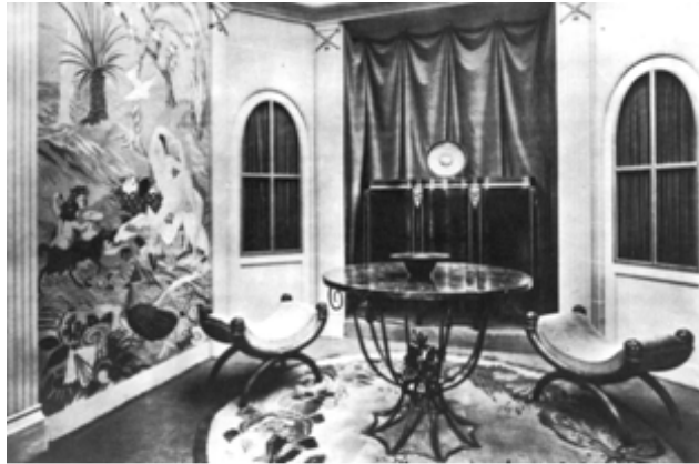
图 6 普里曼沃拉的室内设计

艺术装饰风格的起源可以追溯到新艺术运动。“新艺术”是流行于19世纪末、20世纪初欧洲大陆的一种建筑、美术及实用艺术的风格。新艺术在1900年的巴黎博览会上受到了普通大众的关注，由于它所具有的吸引力而迅速被商业化了，但这也导致新艺术逐渐失去了自己的势头。设计师开始寻求一种前人尚未探索过的新风格，这种新风格既要吸收法国19世纪后期的各种风格，又不落入历史主义的巢穴。在他们看来，新艺术在抛弃传统方面走得太远了，应该将传统的精华与时代的新潮结合起来。1910年，法国装饰艺术家协会成立，其目标是使艺术与设计相结合。一些新艺术的艺术家用改弦易辙，以一种更为简洁的方式来从事装饰艺术，并强调室内设计中家具、墙纸及装饰物品等要素的统一。这些室内设计师在法国装饰艺术界有很高的地位，他们主要为富有阶层服务，设计都极为奢华。一直到20世纪20年代，巴黎依然是法国上流社会荟萃之地。上流人士的赞助，使设计师们能使用昂贵、稀罕的材料创造出有异国情调的风格，以满足有闲阶层猎奇的需要。同时，设计师们也希望利用人们仰慕虚荣的心理，借助富人的财富来引导人们的审美情趣，将新风格推向大众。