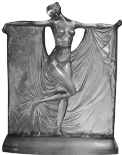
图2 劳里克设计的雕塑