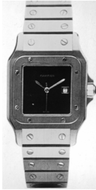
图 3 卡迪埃设计的 “坦克”表