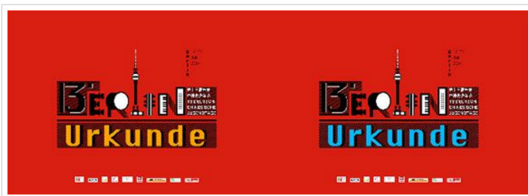
左为参与证书，右为获奖证书