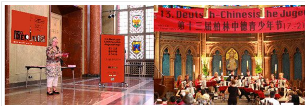
德国红色市政厅演出场景