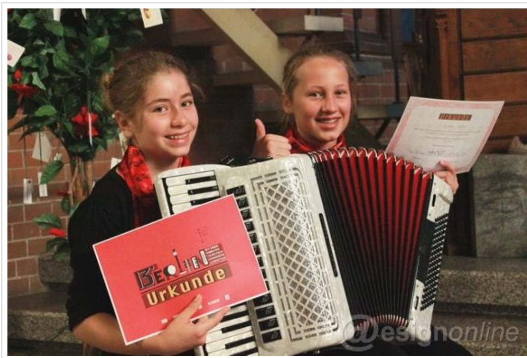
参与活动的德国小朋友手持获奖证书