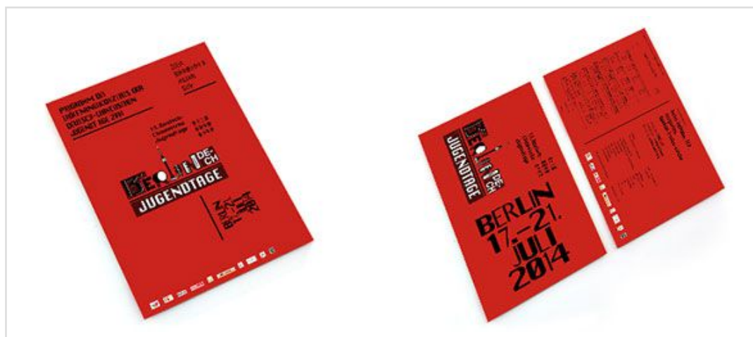
左为节目单封面，右为嘉宾祝词册子的封面封底效果