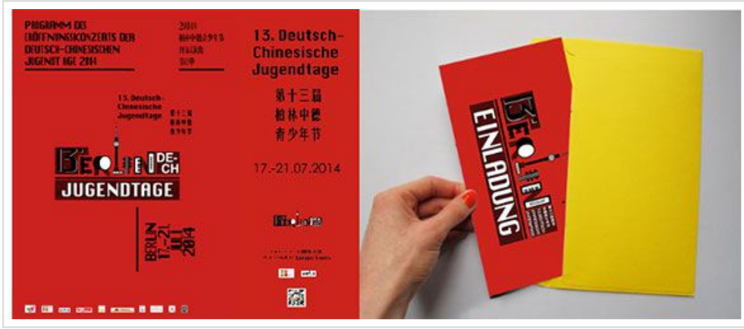
左为节目单封面，中为易拉宝，右为邀请函