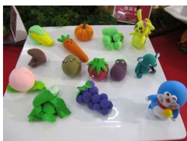
我校举办第15届美食节

5月23日, 2019亚洲“食物-土地-能源-水”系统创新论坛(2019 International Forum on Innovative Food, Land, Energy and Water Systems in Asia)在南京钟山宾馆召开, 论坛由我校亚洲农业研究中心(on WEF and Agriculture) 承办。来自美国、越南、泰国、老挝、柬埔寨、缅甸、乌兹别克斯坦以及国内的及科研机构代表参加了此次论坛。