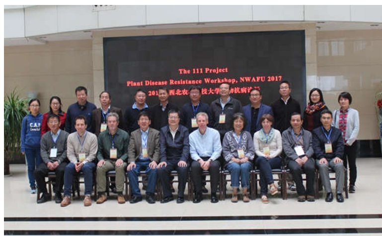
中外专家参加论坛并做报告

本次论坛, 精英荟萃、亮点纷呈。一是“国际化”程度高, 共有来自英国、德国、澳大利亚的6名资深专家学者参会并作报告; 二是论坛质量高, 会议讨论交流深入充分, 国内外专家带来了作物抗病研究领域的新进展和新视野, 让参会师生受益匪浅; 三是促进了学界联谊和学术交流, 促进了引智基地实质性合作研究的开展与人才培养, 必将有力提升我校作物学科点的研究水平及影响力。