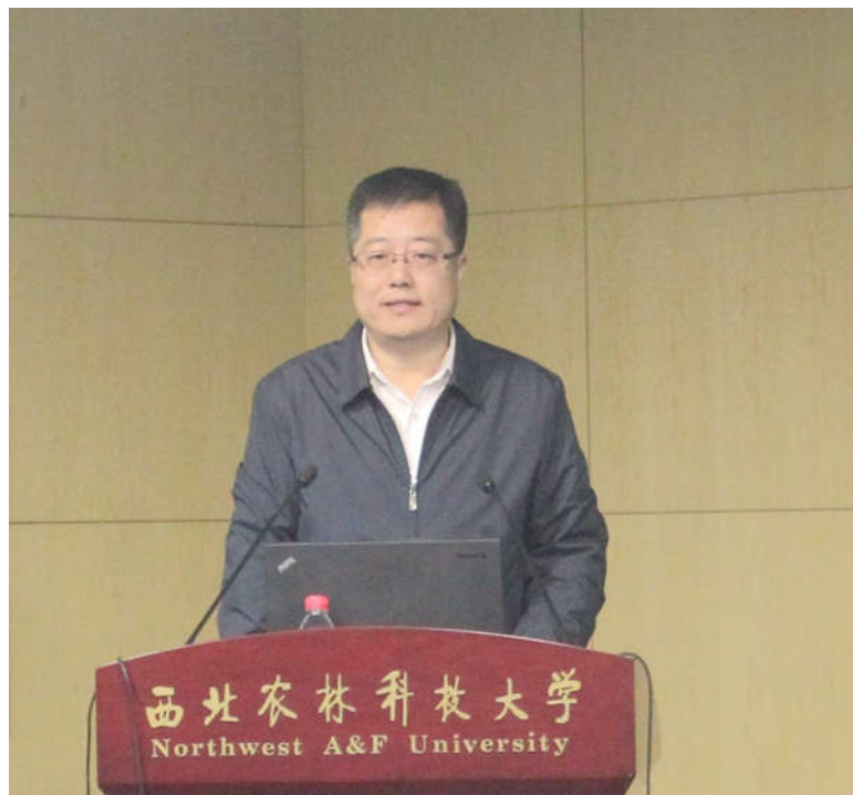
罗军出席论坛并致辞

10月10—11日, 由农学院主办的2017年西北农林科技大学作物抗病论坛在国际交流中心104会议室举行。该论坛受到我校“作物抗病育种与遗传改良创新引智基地”111项目(培育)的资助, 国内外作物抗病育种与遗传改良创新领域的近100余名专家学者和师生代表参加了此次论坛。副校长罗军教授出席会议并致开幕词, 论坛由教育部长江学者特聘教授、农学院院长单卫星教授主持。