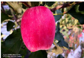
中熟苹果新品种“秦月”通过省级...