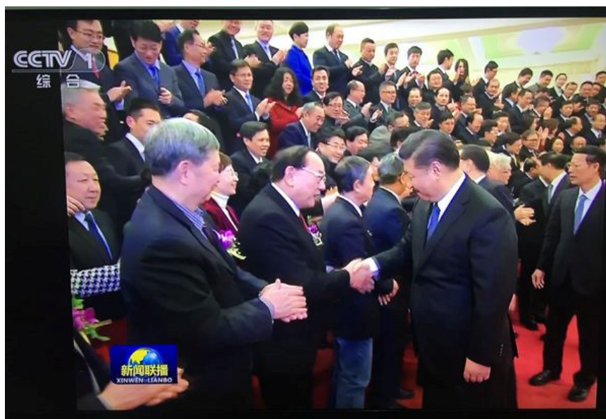
习近平总书记与罗锡文院士亲切握手