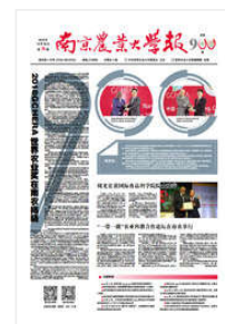
南京农业大学报 (总第900期)