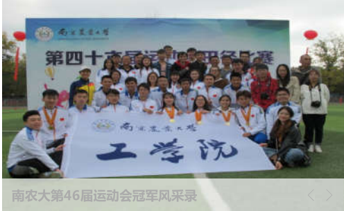
南农大第46届运动会冠军风采录