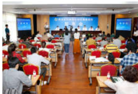
我校西北乡村调查报告在“农民丰...