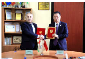
我校与塔吉克斯坦农业科技教育合...