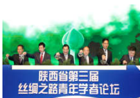
我校承办的陕西省第三届“丝绸之...