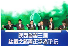
我校承办的陕西省第三届“丝绸之...