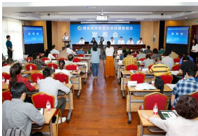
我校西北乡村调查报告：“农民丰...