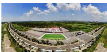
2018年“金秋南农”获奖作品赏

稻瘟病菌引起的稻瘟病是水稻最严重的毁灭性病害，稻瘟病不仅发生于世界各地，而且有可能发生于育苗期，近年来每年给我国造成30亿公斤以上的粮食损失，甚至威胁着全球粮食安全。稻瘟病菌为什么这么最近，我校植保学院张正光课题组揭示了组蛋白乙酰转移酶介导细胞自噬控制稻瘟病菌致病的机制。该研究蛋白乙酰转移酶MoHat1是一支十分“狡猾”的部队，平时只留在细胞核中发挥作用，维持病菌生长发育。病菌侵染寄主植物时，它们会“兵分两路”，一部分继续留在细胞核中“坐镇”，继续“补给粮草”，积蓄力探“军情”；另一部分进入细胞质中，结合“敌情”调整强化“武器装备”，保证病菌可以成功侵染。细胞核外的两支“部队”里应外合，是稻瘟病致病的重要成因。