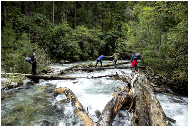
科研人员在调查途中。