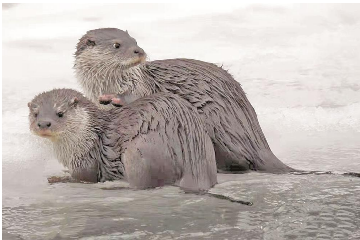
两只欧亚水獭在河道嬉戏。

2022-01-11 15:38:00 来源:青海都市报 作者:祁宗珠【大中小】 浏览:67次 评论:0条