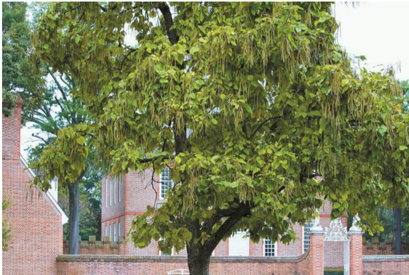
梓树蒴果细长，如一根根筷子悬挂在树上