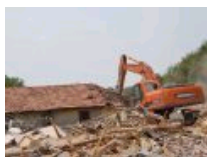
沿湖东路“农家乐”非法经营场所