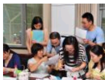
“一站式”服务显便利 七一当日