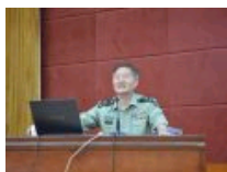
国防信息学院牛力教授来校做国家