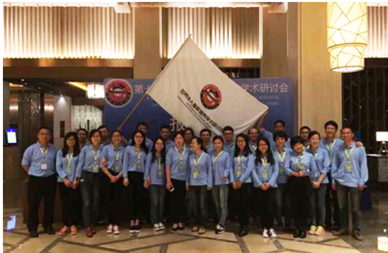
鱼类生理生态组全体工作人员