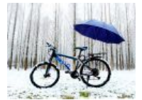
【美丽华农】2016年的第一场雪