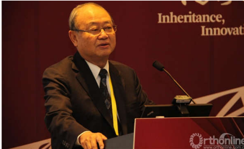
戴尅戎教授现场讲演