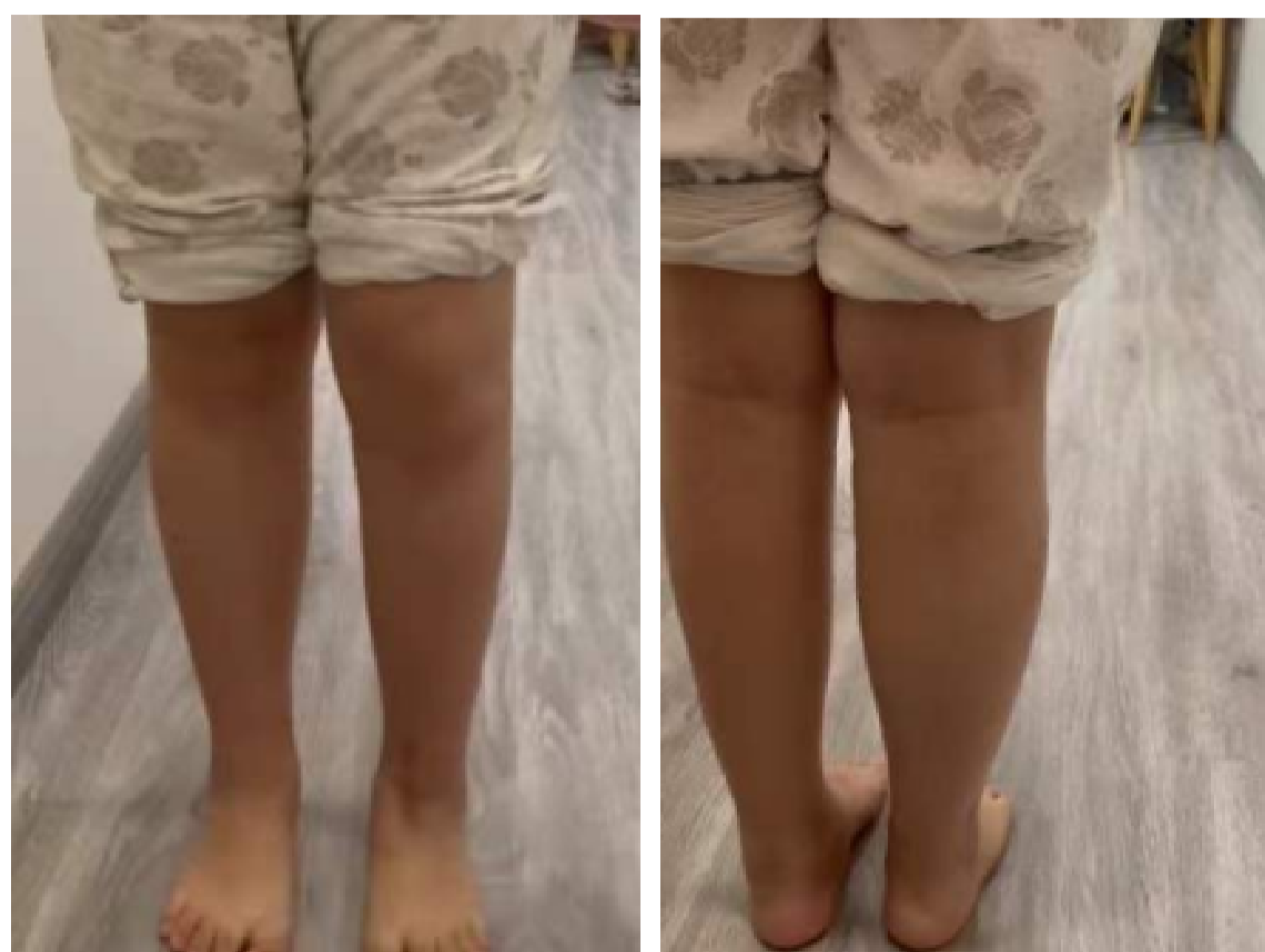
图2. 术后6个月随访照片

手术取得完全成功,2周后创面顺利愈合。术后采用踝关节前后石膏托固定6周;术后6到12周,进行踝关节部分负重下的功能锻炼;术后12周,患儿已可以在无辅助状态下行走,基本恢复术前生活学习状态。术后6个月评估踝关节功能,采用美国足踝外科协会评分(AOFAS)测试结果为85/100。通过角度测量得出双侧踝关节(患侧/健侧)的活动范围依次为:背伸角度35°/40°;跖屈角度45°/50°;内翻角度:25°/30°;外翻20°/30°。负重位踝关节X线示:距骨假体位置良好,患侧和健侧踝关节位线基本一致。