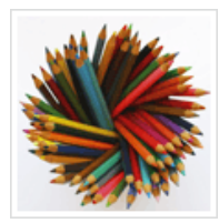
考试第一练兵平台