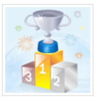
创新之冠花落谁家?