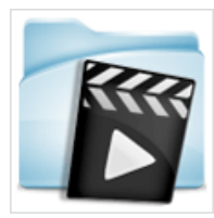
看视频学在线投稿