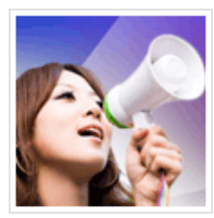
医学编辑中心成立了