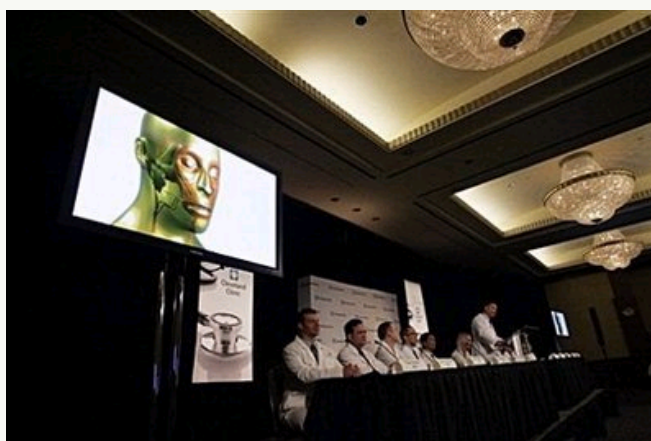
医生向媒体介绍手术情况