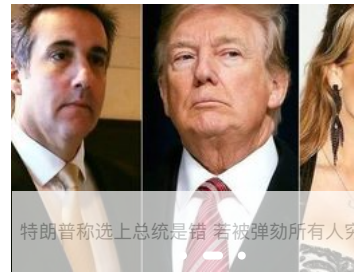
特朗普称选上总统是错 若被弹劾所有人哭