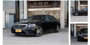
进口奔驰S级火热销售中置换购车有补贴