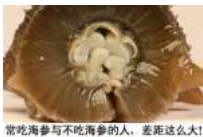
常吃海参与不吃海参的人，差距这么大！