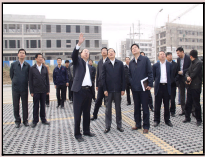
[校园新闻] 省长陈政高视察我校沈北新区校园 (2011-5-4 11:51:25)