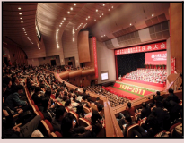
[校园新闻] 中国医科大学80周年校庆庆典大会隆重举行 (2011-7-17 14:39:52)