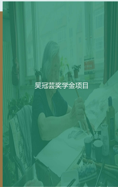
吴冠芸奖学金项目