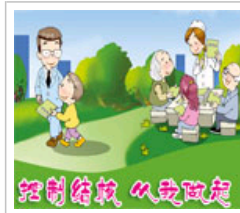
结核病防治知识常见问答