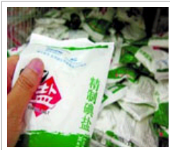
实施食用盐碘含量标准知识问答