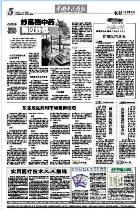
第5版：农村与社区 上一版 ◀ ▶ 下一版