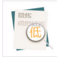
揭秘论文“低价”根源