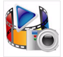
邮箱投稿视频教程