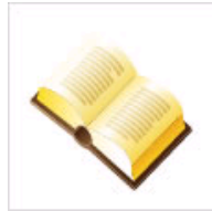
考试宝典-高分练兵场