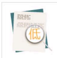
揭秘论文“低价”根源