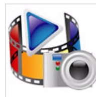
邮箱投稿视频教程