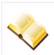
考试宝典-高分练兵场