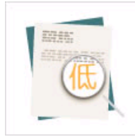
揭秘论文“低价”根源