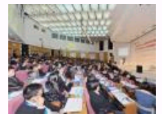
2013第六届中国人力资源管理年会举办 聚议变革