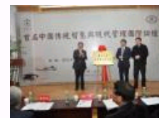
海内外专家南大热议“中国传统智慧与现代管理”