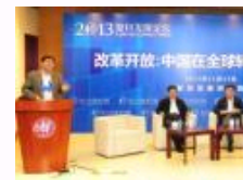
复旦发展论坛共论中国改革的关键