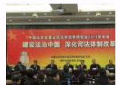
中国法学会董必武法学思想研究会2013年年会举行