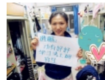
【毕业季】大学四年最遗憾的那些事