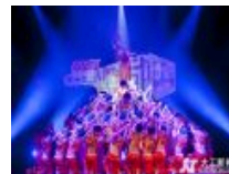
【在现场】关于峰岚杯的N个精彩瞬间