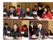
我校举办2013年新闻媒体联谊会