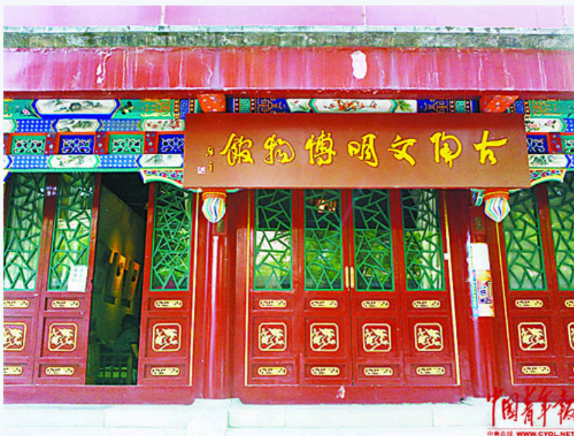
古陶文明博物馆大门

2013年05月21日 19:05 来源: 中国青年报 作者: 蒋肖斌 周珊珊文并摄 浏览: 次 我要评论 字号: 大 中 小