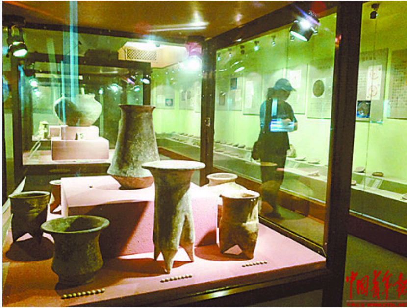
古陶文明博物馆陈列1000余件展品