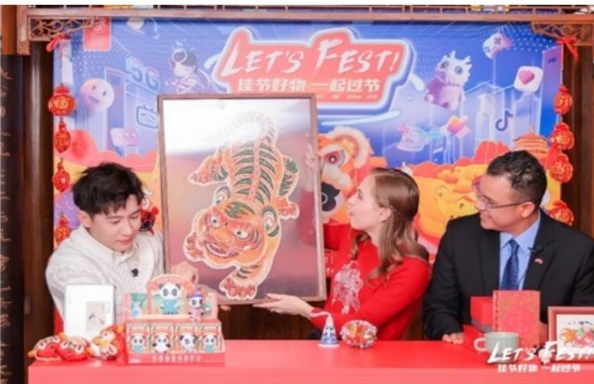
全球连线分享各地过节文化

据了解,文创产品包括敦煌藻井三阶魔方、皮影戏套装、甲骨文礼盒、虎年拼图、春联、兔爷灯笼等,形式多样、特色鲜明,讲述了一个又一个精彩纷呈的中国故事,让中外观众在鉴赏、使用文创产品过程中了解到中国春节的文化习俗,共享阖家欢乐的喜悦。