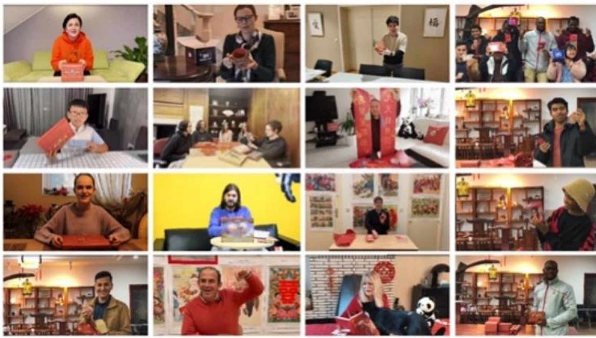
全球友人在线盲盒开箱接力

据了解,文创产品包括敦煌藻井三阶魔方、皮影戏套装、甲骨文礼盒、虎年拼图、春联、兔爷灯笼等,形式多样、特色鲜明,讲述了一个又一个精彩纷呈的中国故事,让中外观众在鉴赏、使用文创产品过程中了解到中国春节的文化习俗,共享阖家欢乐的喜悦。