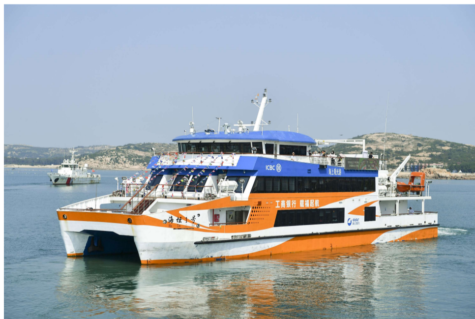
“海坛1号”游船

据悉,“福往福来”海上游平潭—莆田航线是福建省首条跨城、跨岛海上旅游线路,以平潭澳前客滚码头、莆田湄洲湾的湄洲岛官下客运码头作为起讫靠泊码头,乘坐“海坛1号”游船全程用时4小时。