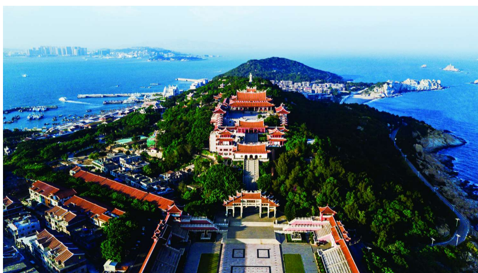
湄洲妈祖祖庙

当“海坛1号”游船停靠在湄洲岛对台客运码头后，莆田市举行了热烈的欢迎仪式，并为游客送上了“莆田文旅一卡通”大礼包。凭借该卡，游客可全年享受涵盖湄洲岛、九鲤湖等全市11个A级旅游景区免首道门票优惠，充分领略莆田滨海风光、感受妈祖文化。