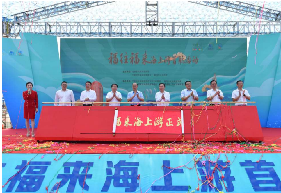
“福往福来”海上游正式首航

近年来,福建省委、省政府高度重视滨海旅游发展,省第十一次党代会提出做大做强做优“数字经济、海洋经济、绿色经济、文旅经济”目标要求,作为海洋经济与文旅经济交叉领域的滨海旅游扬帆正当时。福建省文化和旅游系统紧抓机遇,积极推动“福往福来”海上游启航,串联各地滨海旅游资源,不断丰富旅游业态,持续推动滨海旅游发展提速,不断做大做强“海上福建”。