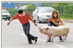
猪贩拉猪险象环生