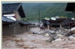
四川凉山发生泥石流