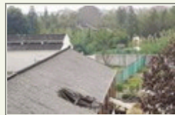
吊车斗车砸进教室